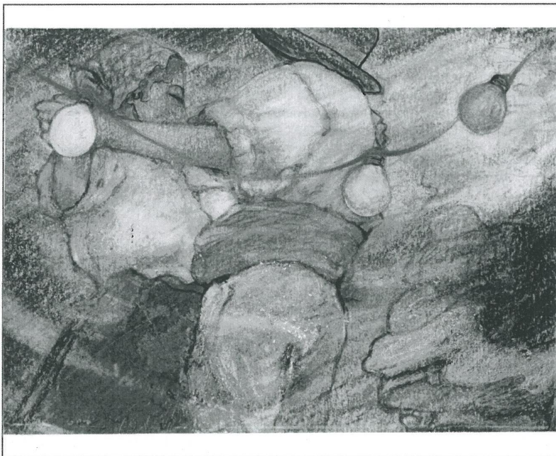
Dessin de Françoise JADIN

L'Administration communale ouvre ses portes du lundi au samedi, de 8h00 à 12h00.